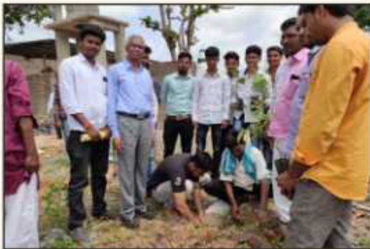
Tree Plantation Drive