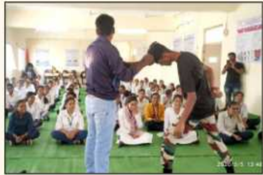
Demo of Self Defense organized by Internal Complaint Committee (ICC)