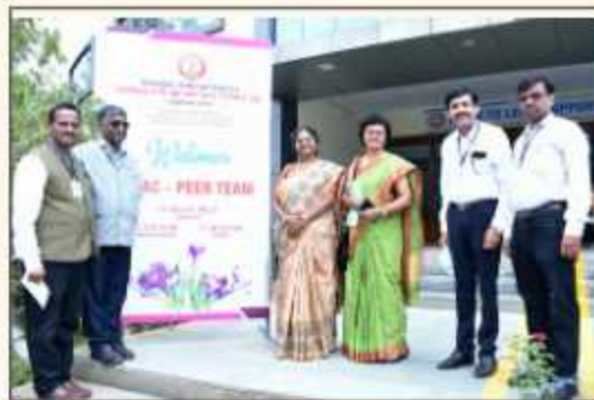
NAAC Peer Team Visit