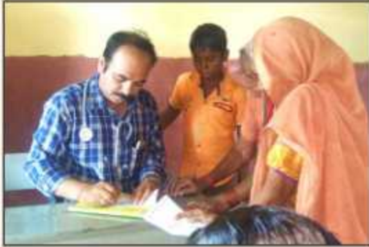
Health Checkup Camp at Wadiwadi organised in Association with Sanjeevani Hospital