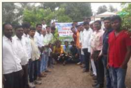
NSS Volunteers, Coordinators and Villagers at Wadiwadi