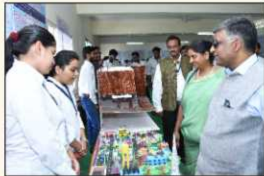
MASSIA Project submission by Civil Engineering Students