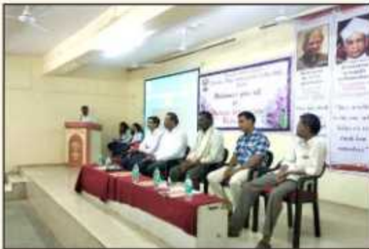
Parents Interaction Program of First Year Engineering Students