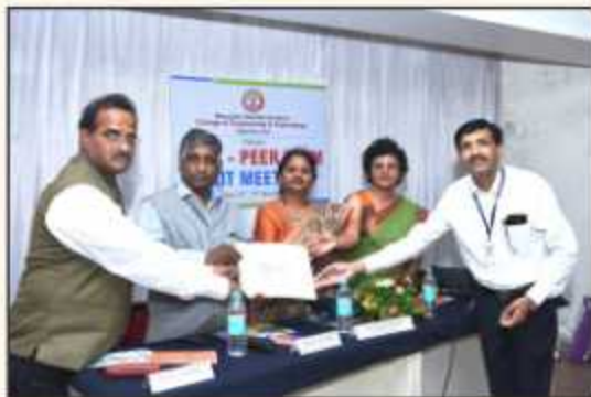
NAAC Exit Meeting and Report submission