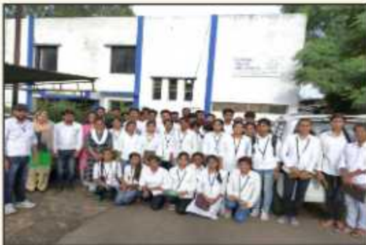
Industrial Visit at Copper Track Industry Nashik