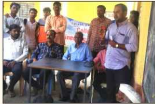
Cancelling by the doctors at NSS Camp