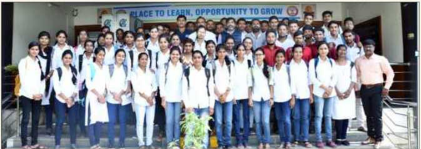
Dignitaries and Student YIN Volunteers at the time of 'Success is within your Grasp' YIN Career Guidance Program