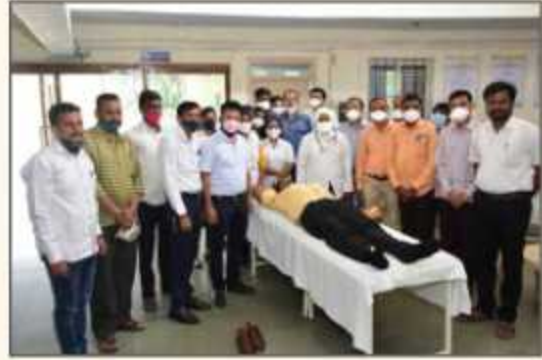
Blood Donation Camp on Birthday Occasion of Hon. Rajeshbhaiyya Tope Saheb (Maharashtra Health and Public Welfare Minister)