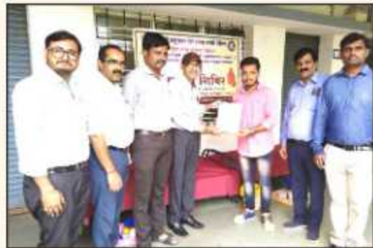
Blood Donation camp organized on the occasion of birth anniversary of Late. Adv. Ankushrao Tope Saheb