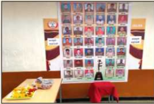
Tribute to Pulwama Martyrs