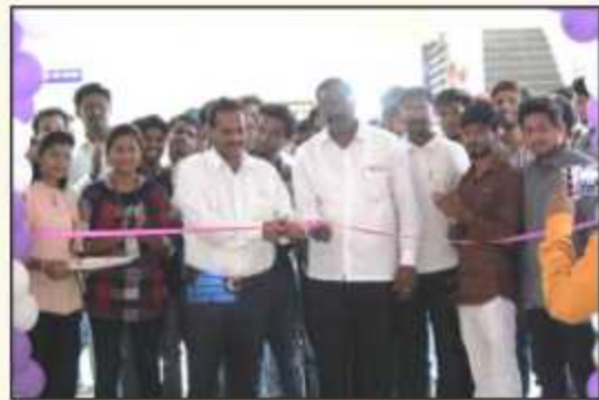
Inauguration of Technical Events Organized by ACES