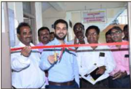
Inauguration of Industry Cell by the hands of Hon. Tanvar Ali (Head, MASSIA, MSME)