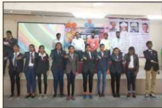
Inaugural Ceremony of Computer Engineering Students Association (CESA) and Oath taking Ceremony