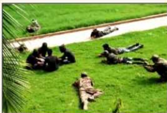
Surgical Strike Skit