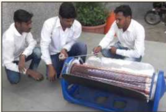
MASSIA Project Submission by the Mechanical Engineering Students