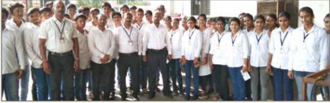
Industrial Visit of FY Students at Approcopp Engineers Pvt.Ltd., Jalna