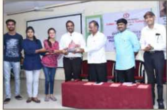
Prize Distribution Program of Poster, Elocution and Essay Competition of 'SVEEP's Voter Awareness Program'