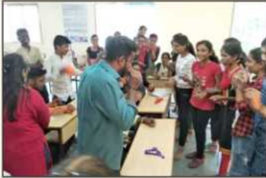
Technical Events Organized by CESA