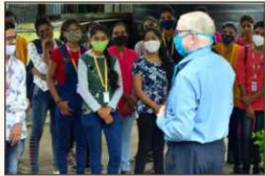
Industrial Visit of YIN Volunteers at Vinodrai Engineers Pvt. Ltd. Jalna