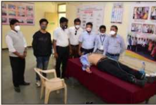
Health Check-up Camp on Birthday Occasion of Hon. Rajeshbhaiyya Tope Saheb (Maharashtra Health and Public Welfare Minister)