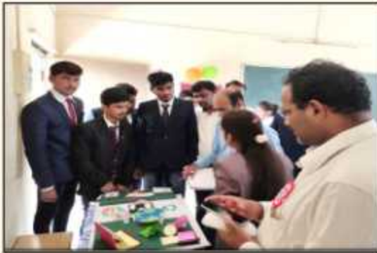
Poster Competition organized under EESA