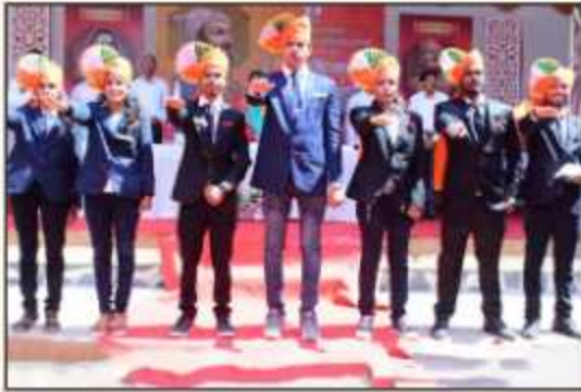
Selected SRC Members taking oath