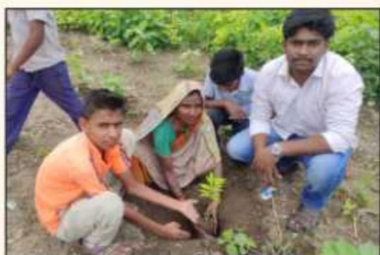
Tree Plantation by Villagers