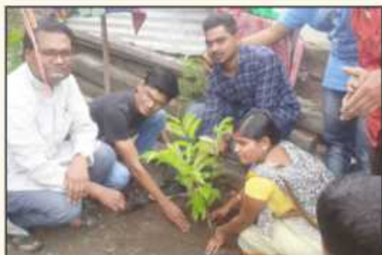
Tree Plantation by the villagers of Wadiwadi