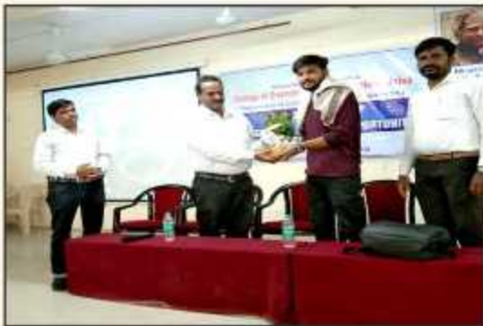
One day Workshop on 'Data Science Scope & Opportunities' by Hon. Raj Sharma from simplifying skill Employability program pune