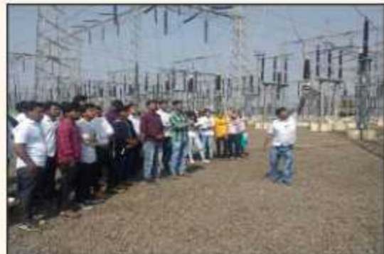
Industrial visit to 220KV substation at Benda