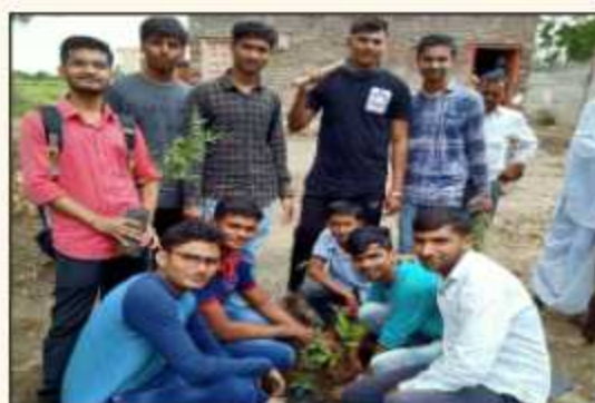
NSS Volunteers at the time of Tree Plantation